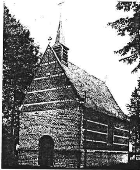
Heemkundige Kring « Berla » Meise - Oppem - Wolvertem en omgeving